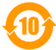
Symbol 02 „EFUP“- 10 Jahre