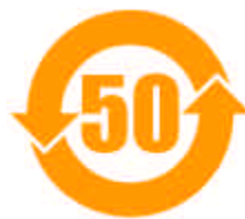
Symbol 04 „EFUP“- 50 Jahre