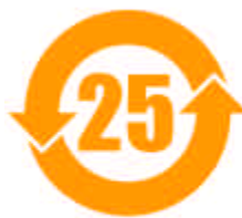
Symbol 03 „EFUP“- 25 Jahre